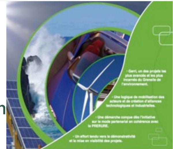
Gerrri, projet soutenu par : www.gerrri.fr